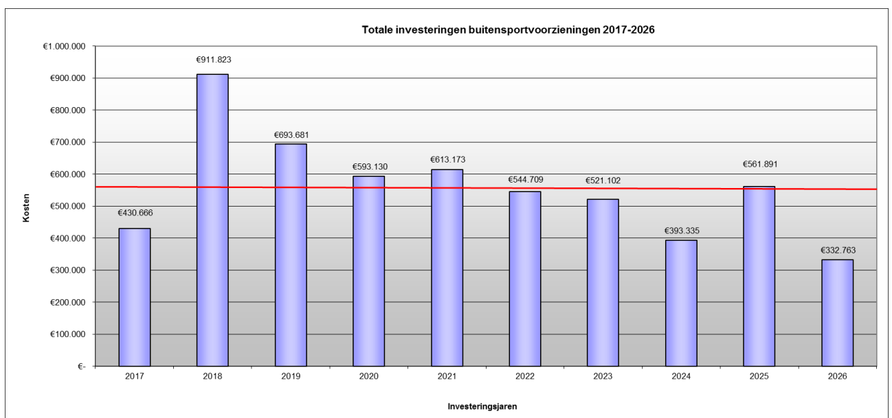
Grafiek 1: totaal aan investeringen per jaar.

Hieronder wordt aangegeven hoe wij na uw vaststelling het MIP gaan hanteren. De toepassing hiervan leidt uiteindelijk tot de definitieve cijfers en voorstellen die wij jaarlijks via de Nota Kaders aan u ter besluitvorming zullen voorleggen.