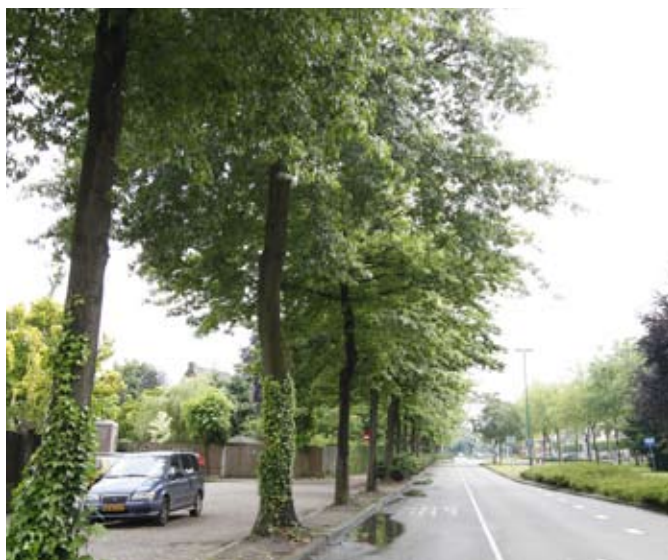
Moeroseiken nabij de Parallelweg-Noord