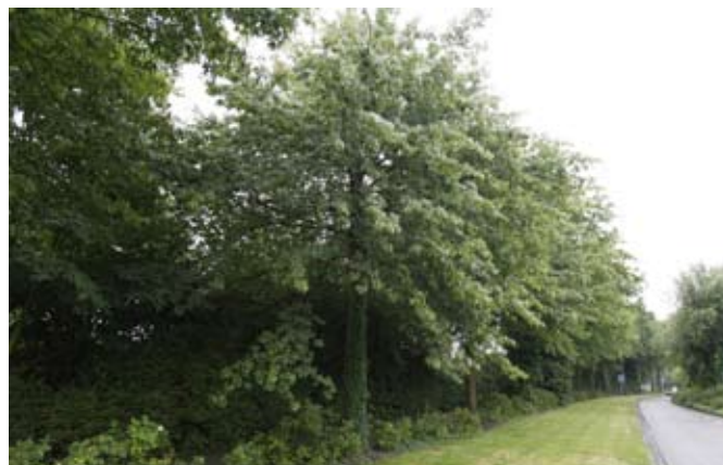
Moeroseiken nabij kruising Leenderweg (grenzend aan achtertuinen Hazestraat)

Op het moment dat u deze nieuwsbrief leest, zijn twee bureaus geselecteerd. Zij gaan nu aan de slag met het maken van bestekken (de werkomschrijving en de bijbehorende tekeningen).