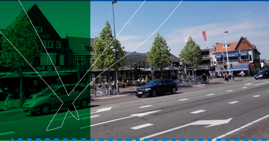
Egbert Buiten wethouder economische zaken