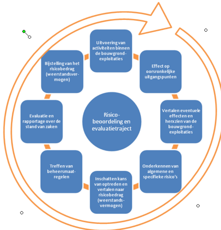
Periodiek systeem voor risicobeoordeling, -beheersing en -rapportage

Uiteraard zullen vanuit een adequaat gevoerd risicomangement ook de positieve variabelen binnen een project, zoals win/winsituaties, beter inzichtelijk gemaakt en benut kunnen worden. Risicomangement wordt daarmee tevens een continu en dynamisch proces.