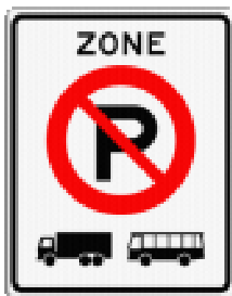
Afbeelding 1: E201 zb

De fabrikanten van verkeersborden hebben voor het aanduiden van een zone verboden voor parkeren grote voertuigen het bord E201zb (zone begin) en E201 ze (zone eind) ontwikkeld. Voorgesteld wordt deze borden te plaatsen bij de grenzen van de bebouwde kommen en op de grenzen van de gebieden waar wel geparkeerd mag worden.