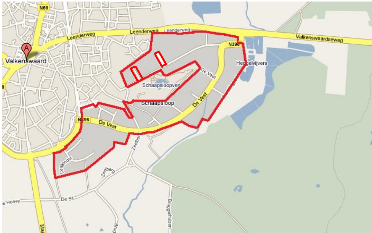
Kaart 1: Schaapsloop I en Schaapsloop II waar parkeren door grote voertuigen is toegestaan.