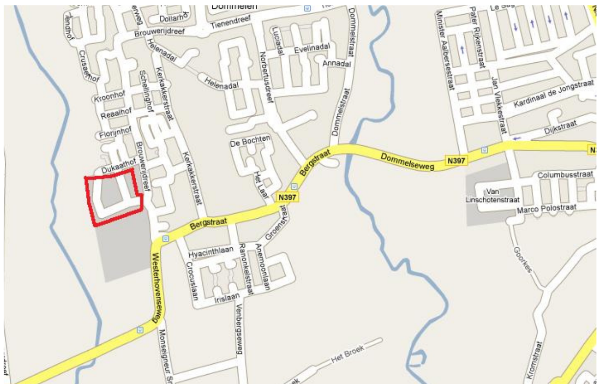
Kaart 2: Dommelen waar parkeren door grote voertuigen is toegestaan